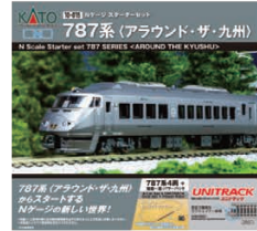
スターターセット 787系(アROUND・ザ・九州)