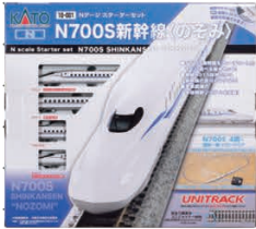
スターターセット N700S新幹線「のぞみ」