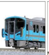
IR1いかわ鉄道 521系(黄土系)