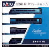
E261系 「サフィール踊り子」