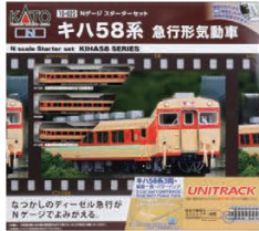
スターターセット キハ58系 急行形気動車