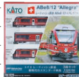
レーティッシュ鉄道 ABe8/12(アレグラ)