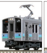
E127系100番台 (更新車・霜取りパンタ搭載)