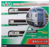
E259系 「成田エクスプレス」 (リニューアルカラー)