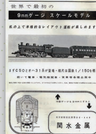
▲初代Nゲージ C50 発売当時の雑誌広告