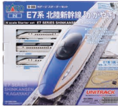
スターターセット E7系 北陸新幹線「かがやき」