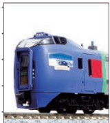
キハ283系 「オホーツク・大雪」