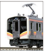
E129系100番台 (霜取りパンタ搭載車)