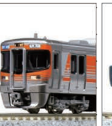
313系8000番台 (東海道本線)