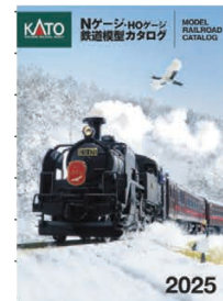
KATO Nゲージ・HOゲージ 鉄道模型カタログ 2025