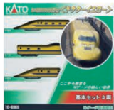
923形3000番台 (ドクターイエロー)