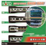
E231系1000番台 東海道線(更新車)