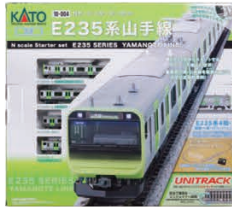
スターターセット E235系山手線