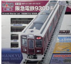
スターターセット 阪急電鉄9300系