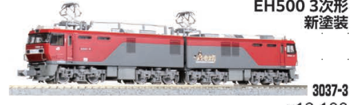
EH500 3次形 新塗装