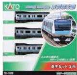
E233系1000番台 京浜東北線