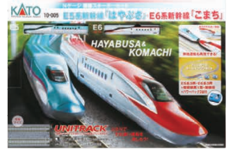
複線スターターセット E5系<はやぶさ>・E6系<こまち>