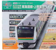
スターターセット E233系 3000番台 東海道線・上野東京ライン