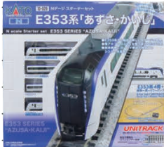
スターターセット E353系「あずさ・かいじ」