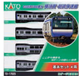
E235系1000番台 横須賀・総武快速線